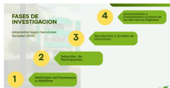
Figura 1. Fases de la intervención

Nota: Fases adaptadas según Hernández Sampieri (2019).