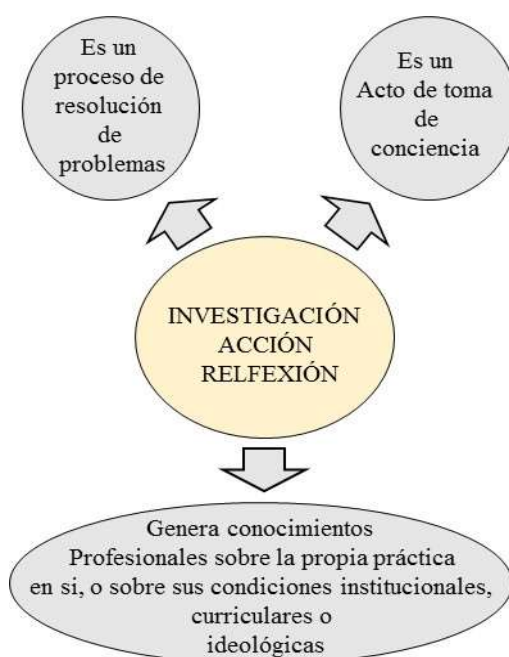
Figura 1. Investigación Acción Reflexión

Como técnicas de recogida de información se utilizaron la observación directa, entrevista semiestructurada, diario de campo y grupos de discusión. Los participantes de la investigación son seis: tres mujeres y tres hombres, todos integrantes del grupo de danza folclórica de la Universidad de Córdoba; estos se seleccionaron teniendo en cuenta su interés y disposición para participar de la investigación luego de haber realizado una invitación a todo el grupo de danzantes. Este colectivo de seis jóvenes constituyó el grupo IAR, con el cual se desarrollaron las diferentes fases de la investigación, con ellos se diseñaron los talleres, se analizaron las entrevistas y las transcripciones de las narrativas del primer grupo de discusión. Cada grupo de discusión sirvió para planear, diseñar y discutir las intervenciones, al final una última reunión develó la matriz de necesidades humanas y satisfactores elaborada a partir de sus testimonios y reflexiones.