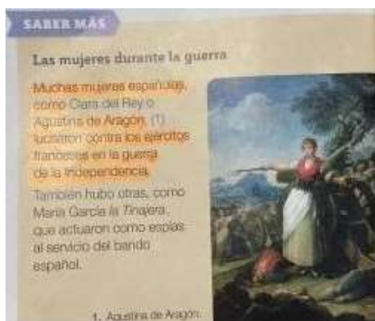
Imagen 5. Imágenes sobre mujeres en la Historia.