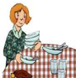
Imagen 9. Imágenes con acciones vinculadas a la mujer: recoger la mesa.

Al finalizar la comida, Andrea quita la mesa.