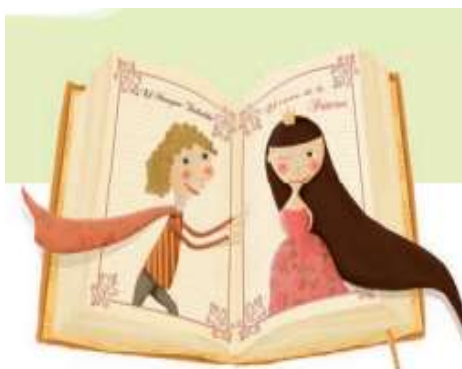
Imagen 11. Selección de imágenes de niñas princesas.