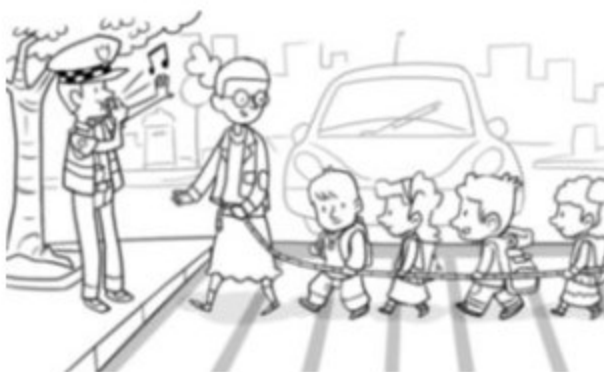
Imagen 2. Icono masculino y femenino en ámbitos profesionales.