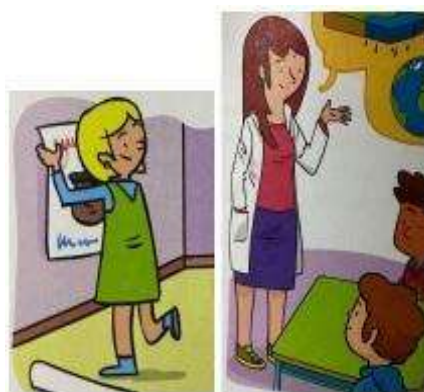
Imagen 6. Imágenes que muestran la caracterización de vestido/falta.