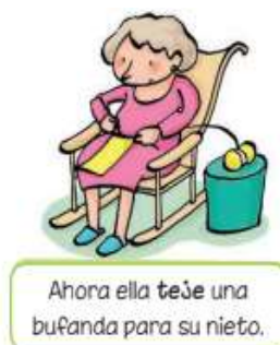
Imagen 13. Mujeres ancianas asociadas a la actividad de la costura.

Ahora ella teje una bufanda para su nieto.