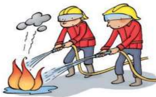
Imagen 1. Iconos masculinos en ámbitos profesionales.