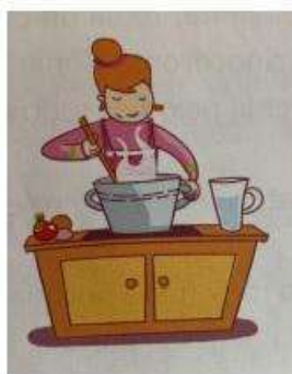
Imagen 8. Imágenes con acciones vinculadas a la mujer: cocinar.