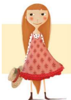
Imagen 7. Imágenes que muestran la caracterización de vestido rosa.