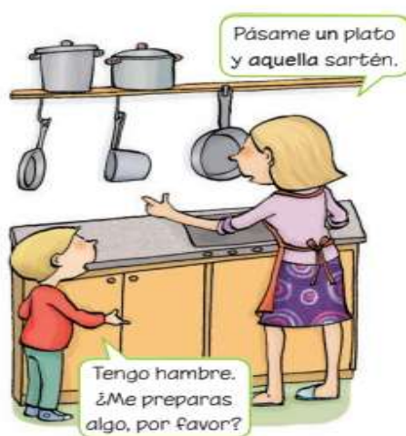
Imagen 10. Selección de imágenes de mujer en la cocina.