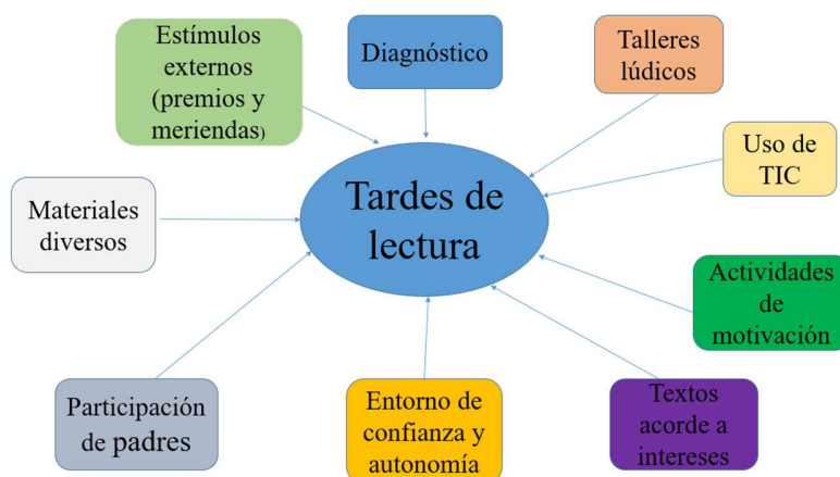
Gráfico 2: Elementos de la estrategia de promoción de lectura.

Se visualizan los elementos clave del proyecto Tardes de lectura y cómo se integran. Se representan los componentes principales del proyecto, como son el diagnóstico, el apoyo de los padres, los talleres, el uso de TIC, la motivación, los textos según intereses, el entorno, los materiales y los estímulos, todos convergiendo hacia la construcción de una estrategia efectiva de promoción de la lectura. En la Tabla 2 se resume la información de los talleres que se llevaron a cabo.