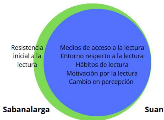
Gráfico 1: Comparación de categorías emergentes durante la implementación del proyecto.

Como se observa en el Diagrama de Venn expandido (Gráfico 1) se presentan las categorías emergentes en ambos municipios. Tanto en Suan como en Sabanalarga se identificaron similitudes en cuanto a motivación por la lectura, medios de acceso a la lectura, hábitos de lectura y entorno lector. Sin embargo, en Sabanalarga se identificó una categoría adicional: resistencia inicial a la lectura, lo que sugiere que los estudiantes de esta zona mostraron más dificultades para involucrarse en las primeras etapas del proyecto. En ambas comunidades, surgió la sexta categoría, el cambio en la percepción de la lectura, lo que refleja el impacto positivo de la intervención en la transformación de actitudes hacia la lectura. Las categorías se explican en la Tabla 1.