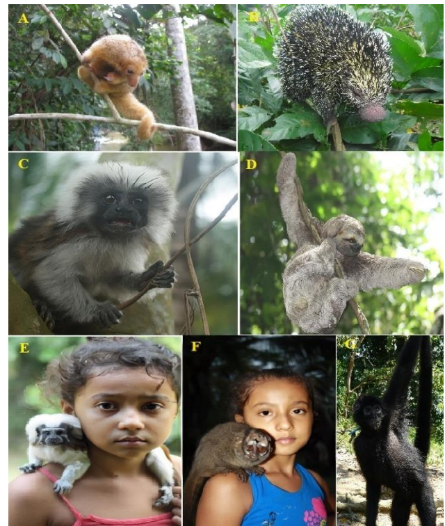
Figura 3. Registro fotográfico de especies de mamíferos registrados en la Vereda Zancón interior del PNN-Paramillo, Tierralta- Córdoba: (A) Cyclopes dorsalis , (B) Coendou quichua , (C) Saguinus oedipus , (D) Bradypus variegatus , (E) Aotus griseimembra , (F) Ateles fusciceps .

En cuanto a las narrativas, se evidenció que existen leyendas relacionadas con las experiencias de los campesinos con los mamíferos, entre los cuales se encuentran el puma ( P. concolor ), el jaguar ( P. onca ), el burro danto ( T. terrestris ) y el oso de anteojos ( T. ornatus ). Estas narraciones están profundamente arraigadas y son grabadas por las personas mayores. En conversaciones con miembros de la comunidad, relatan cómo cazaban jaguares ( P. onca ) utilizando cartuchos de escopeta cargados con balines de molino, una actividad realizada en represalia por los ataques a animales domésticos como vacas, caballos, burros y perros. También mencionaban el uso medicinal que le daban a la grasa de jaguar y burro danto, empleándola como remedio para dolores reumáticos, un uso común entre las comunidades indígenas y campesinas de Colombia (Figuerola-Pizarro, 2008).