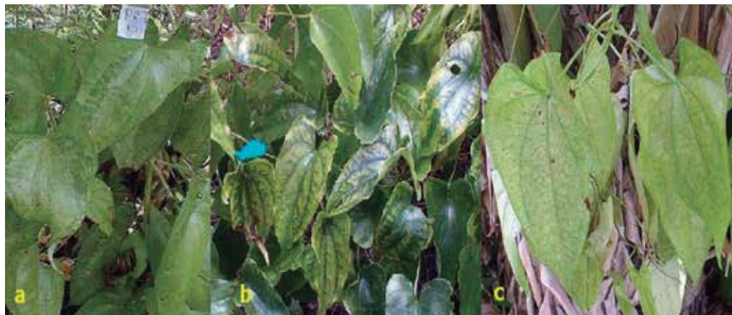
Figura 1. Síntomas encontrados en los cultivos de ñame en Sucre. a. Moteado; b. Bando de venas; c. Mosaico.

Las observaciones sobre la aparición de sintomatologías se realizaron a partir del segundo día de haberse realizado la inoculación y la evolución subsiguiente de los síntomas se realizó a diario por siete semanas.